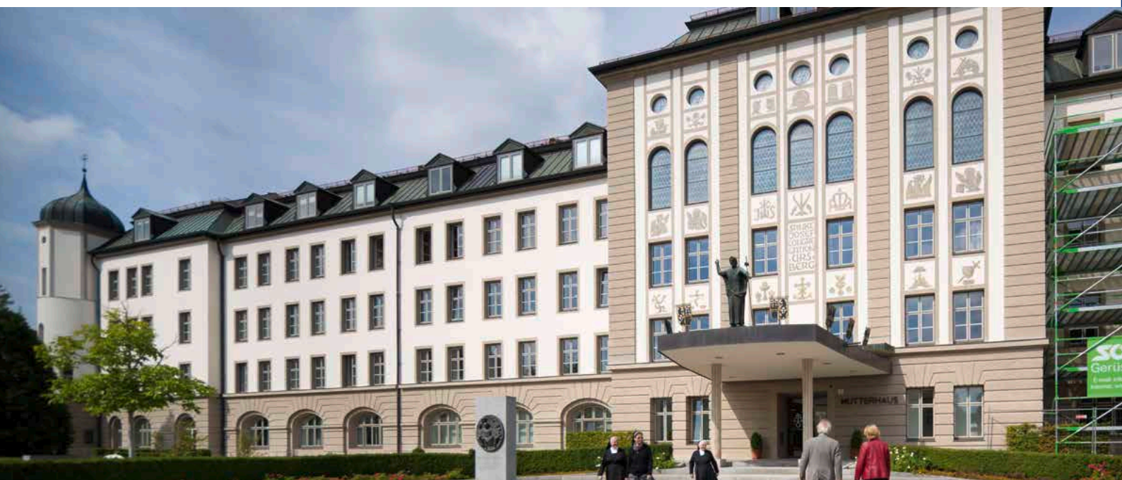
Domnikus-Ringeisen-Werk im Ursberg, renoviert im Histolith-System.

Die Mineralfarben wurden kontinuierlich weiterentwickelt und dem neuesten Stand der Technik angepasst. Mit Histolith steht dem Handwerker ein in Deutschland hergestelltes Programm ausgereifter, perfekt aufeinander abgestimmter mineralischer Farben und Putze zur Verfügung.